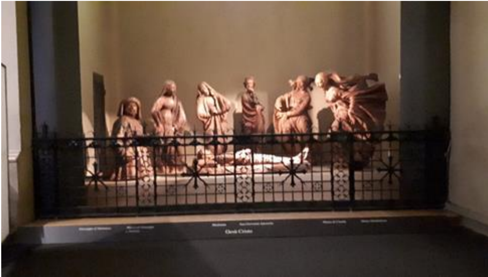
Compianto sul Cristo morto - Niccolò dell'Arca, chiesa di Santa Maria della Vita a Bologna.

Prima del...DOPO DEFINITIVO (terreno) ...PELLEGRINAGGI A VIGORSO DI BUDRIO