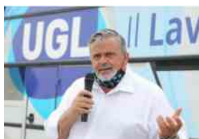
Giornata mondiale del lavoro dignitoso, l'appello di Capone