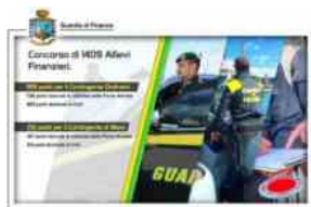
GdF Isernia, concorso per reclutamento di 1409 allievi finanziari