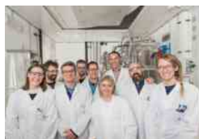
Campagna recruiting della F.I.S. anche per lo stabilimento di Termoli