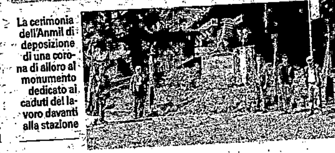
La cerimonia dell'Anmil di deposizione di una corona di alloro al monumento dedicato ai caduti del lavoro davanti alla stazione

MONZA (nsr) Un aiuto per l'acquisto di servizi di consulenza, formazione e tecnologie in ambito Industria 4.0.