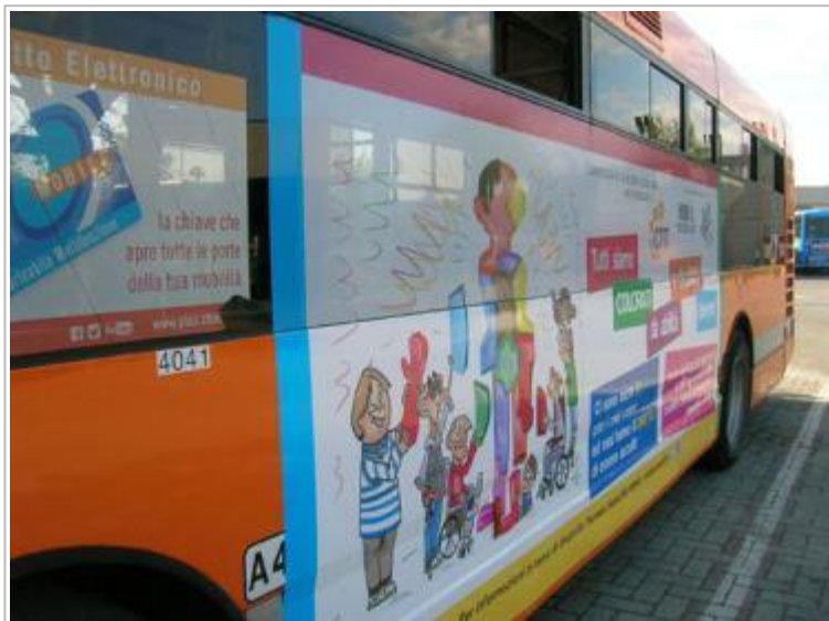
Il grande manifesto sulla fiancata dell'autobus di CTT Nord, con il disegno realizzato da Michele Russo

Per la durata di tre mesi, dunque, due autobus di linea di Lucca saranno allestiti con un grande manifesto della campagna che mira a portare all'attenzione dell'opinione pubblica il tema dei diritti delle persone con disabilità , attraverso un'accattivante vignetta realizzata appunto da Russo.