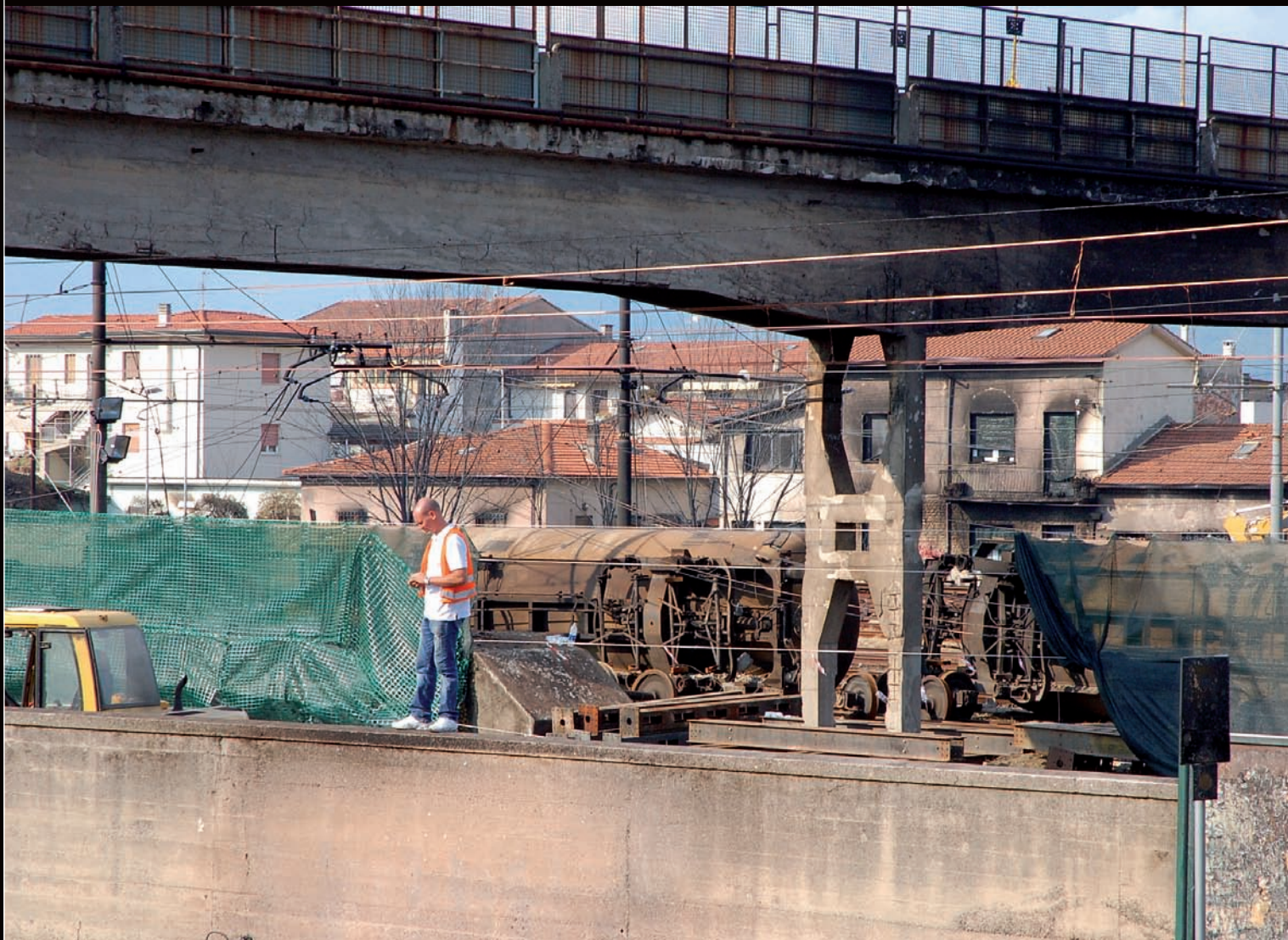
Incidente ferroviario di Viareggio

ASSOCIAZIONE NAZIONALE FRA MUTILATI ED INVALIDI DEL LAVORO