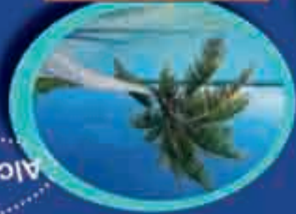
Messico - Riviera Maya Hotel 4 stelle - 7 giorni Costo 1.121,00*