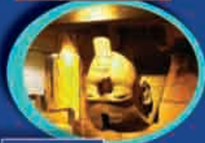
Egitto - Giocosa sul Nilo Mediterraneo 4 stelle Lusso Costo 888,00*