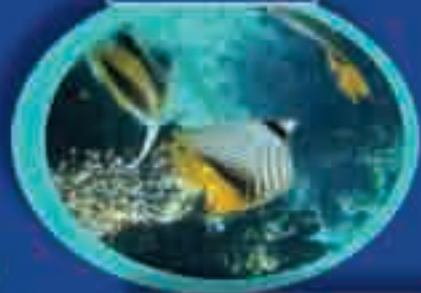
Maya Tzuc - Guatemala (Doppia) Pacchetto 4 stelle - 7 giorni Costo 593,00*